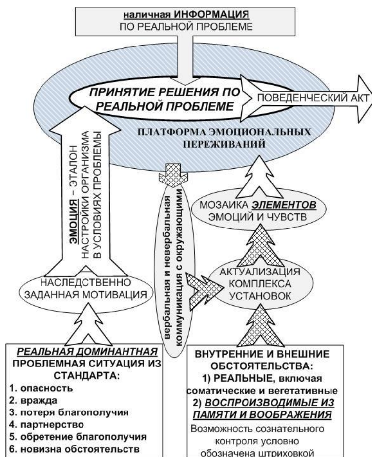
Рис. 3. Платформа эмоций и переживаний в проблемной ситуации

Эмоциональный потенциал личности отражает состояние платформы эмоциональных переживаний. С одной стороны, он служит показателем уровня переживаний и их влияния на мобилизацию интеллекта, а с другой – характеризует способность индивидуума оценивать свои переживания и сопереживать окружающим. Достижение взаимопонимания и сопереживания представляет собой проблему, актуальность которой возрастает по мере современного раскрепощения поведения. Готовность к невербальному общению вместе с навыками «эмоционального резонанса», то есть, умения воспринимать невербальные послышки – это явления, которые обусловлены уровнем эмоционального потенциала.