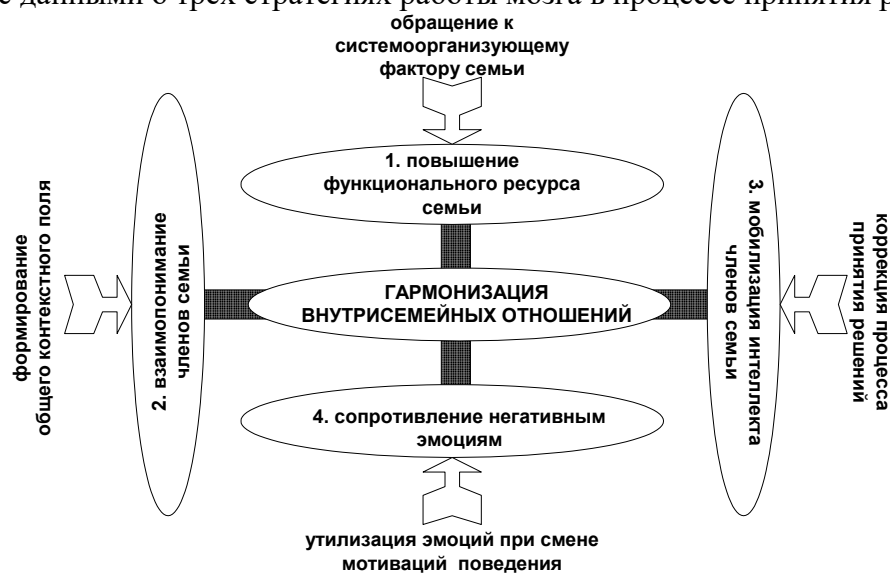
Рис. 1. Направления и механизмы воздействия ССТВВ с целью гармонизации внутрисемейных отношений. Цифрами обозначены номера подходов.

вербальных и невербальных посылок, в которых сопряжены смысловая и эмоциональная составляющие. Выяснение несовпадений мнений по поводу событий и согласование противоречий позволяет исправить несоответствие контекстов и восстановить взаимопонимание. В третьем подходе ССТВВ фокусирует усилия на помощи членам семьи в согласованном принятии ответственных решений. Мобилизация интеллекта характеризуется способностью учесть максимум доступных сведений, распределить их по степени достоверности и значимости, а затем выстроить цельный образ проблемной ситуации. Поскольку достоверные сведения недостаточны и противоречивы, формулируются гипотезы. Чем выше мобилизация интеллекта, тем полнее гипотезы отражают ситуацию и тем ниже вероятность ошибки в принятии решения. Стратегии мобилизации интеллекта выбираются в соответствии с данными о трех стратегиях работы мозга в процессе принятия решений.