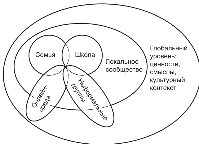
Рисунок 1.2. Схема соотношения «сред социализации»

с разнообразием моделей родительства, образовательных траекторий, возможностей и рисков локального сообщества и поляризации ценностно-смысловых установок, характерных для глобального уровня, схема последовательного «включения» сред социализации, с нашей точки зрения, «упускает» возросшую «сложность» современного мира и, в некотором роде, перестает быть актуальной. Альтернативная схема представлена на рис. 1.2.