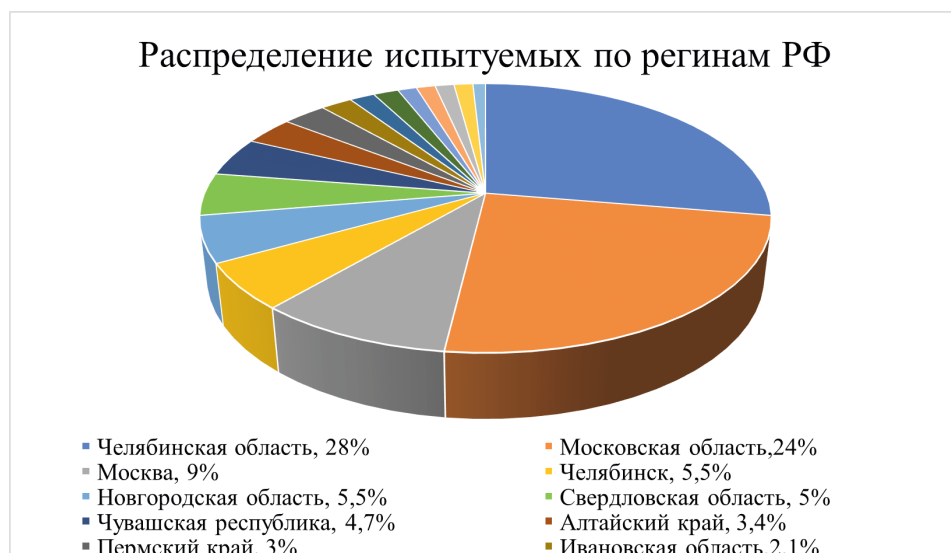
Рис. 2. Распределение испытуемых по регионам России