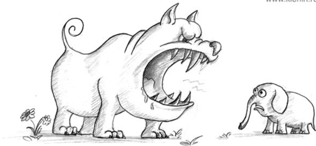
слон и Моська