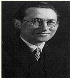
Курт Левин (1890-1947)